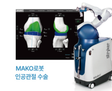
MAKO로봇 인공관절 수술